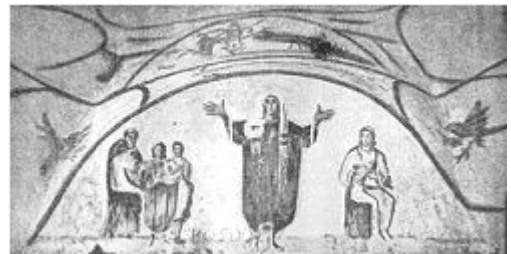
Fresco en la catacumba de Priscila, Roma, año 300

En el siglo III comenzó una grave crisis dentro del Imperio Romano. Los generales de los ejércitos romanos luchaban encarnizadamente por el poder en el periodo denominado “tetrarquía” mientras que los pueblos germanos avanzaban y sacudían las fronteras del imperio en el noreste de Europa. La diferencia de clase entre ricos y pobres se acrecentó mucho más, y esta fue la razón por la cual el cristianismo calaba entre los desposeídos. El cristianismo primitivo supo ser más atractivo a ojos de los pobres, ya que daban referencias frente a un panteón de dioses que perdía autoridad y credibilidad. Los discursos que promovían sus líderes hablaban de comunidades entre iguales, un único dios, salvación eterna, etc., dentro de una civilización que agonizaba, se desmoronaba y carecía de integridad. Esta nueva concepción de la religión se empezó a extender por todo el imperio y fue perseguida hasta la ascensión al poder de Constantino.