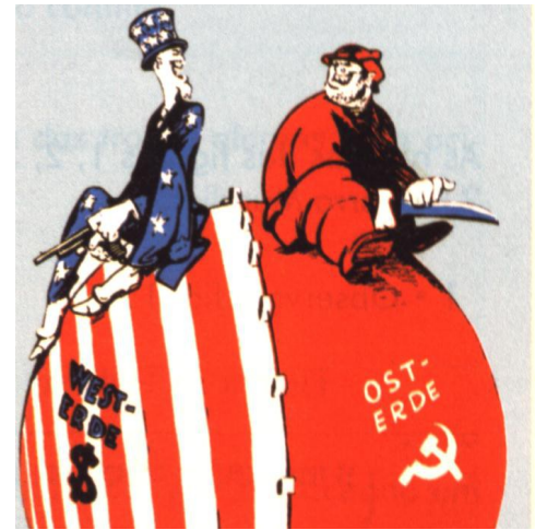
Imagen de una guerra bipolar

Es a partir del término de la II Guerra Mundial cuando los gobiernos hacen especial énfasis en un proceso de construcción europeo, primero económico y más tarde político y social. La situación política entonces en Europa es la división de Alemania en dos, una parte controlada por EE.UU., Gran Bretaña y Francia, llamada República Federal Alemana (RFA), y la otra controlada por la URSS, llamada República Democrática Alemana. Mientras Europa está devastada se forjan como grandes potencias EE.UU. y la URSS, y se afianza la socialdemocracia liberal de los países nórdicos. Rusia, de ser un país que vivía en un régimen absolutista y feudal, pasó, después de la Revolución de Octubre y de la toma de poder por los bolcheviques, a industrializarse y convertirse en una de las potencias máximas que desencadenó la llamada Guerra Fría. Existieron entonces distintos tipos de movimientos y pensamientos europeístas: