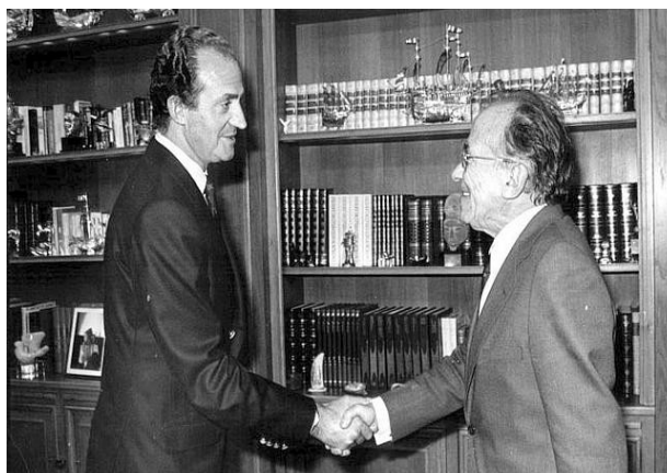
Juan Carlos I y Santiago Carrillo

Se acepta la llamada Comunidad Económica Europea con el argumento de la defensa del estado del bienestar y los derechos sociales emanados de este por parte de los países del oeste de Europa después de la II Guerra Mundial, y la posibilidad de participación de los trabajadores en el diseño de este modelo.